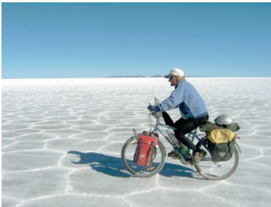
En el salar de Uyuri (Bolivia), julio 2004