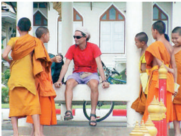
Ayuthaya (Tailandia), agosto 2002

La biblioteca pública tiene una razón de ser acojonante. Puede parecer que por vivir en un mundo cada vez más individualizado y más corrupto la gente abandone las bibliotecas. Pero, al revés, la gente va mucho. Allí donde haya, la ley universal es que va a haber estudiantes, sus principales frequentadores. A medida que hay posibilidad de acceso a periódicos, Internet... se diversifica el público que acude. 📧