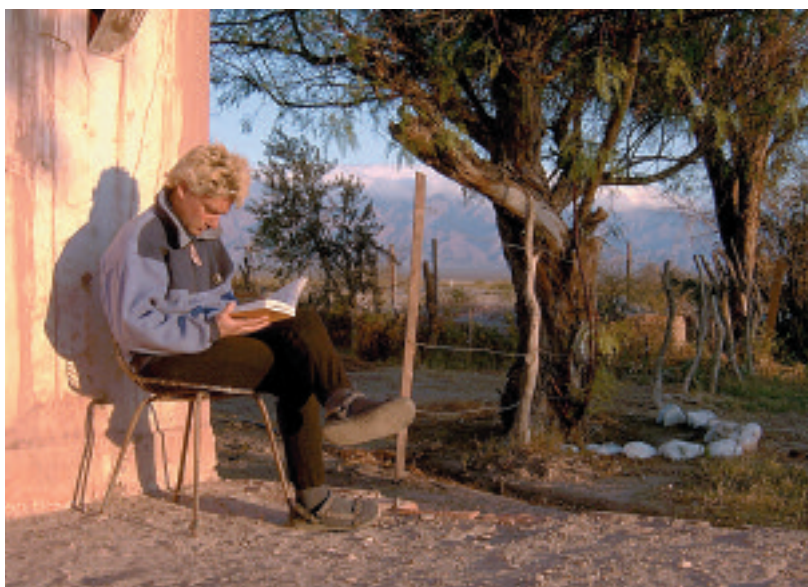
Estación Mazán, La Rioja (Argentina), junio 2004