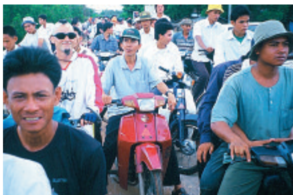
Entrando a la ciudad de Kampot (Camboya), mayo 2002