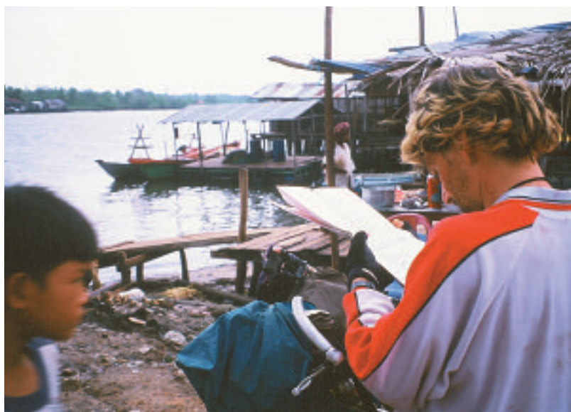
Elephant Mountains (Camboya), mayo 2002