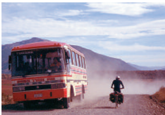
Cerro Castillo (Chile), febrero 2004